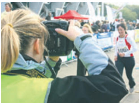
Ein Fotografen-Team versuchte, jeden Teilnehmer beim Zieleinlauf zu fotografieren. Die Gesamtbilanz der Vier: 28 000 Aufnahmen.