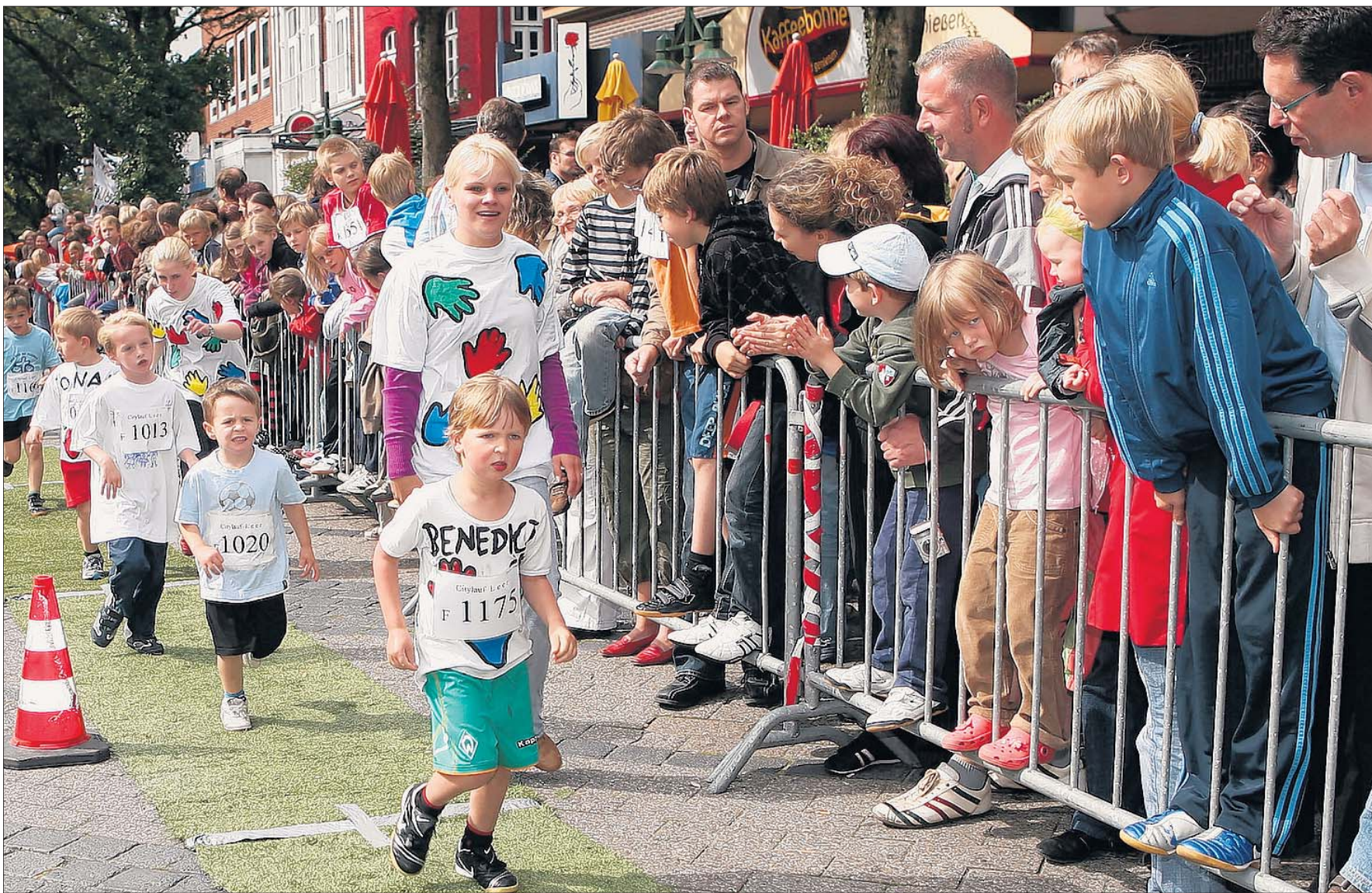
Erschöpfte Kinder und begeisterte Eltern beim Zieleinlauf. Die Bambini-Läufe waren eine bunte und spannende Sache.