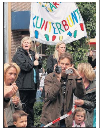
Fans am Rand hatten die Kleinen vom Kindergarten Kunterbunt.