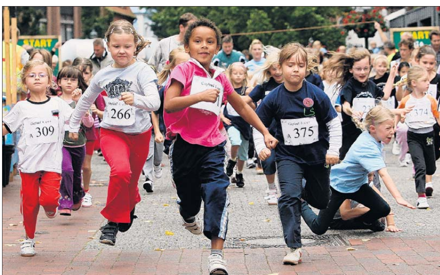
Voller Elan startete der Nachwuchs. Es lief nicht bei allen nach Wunsch, wie der Sturz (rechts) zeigt.