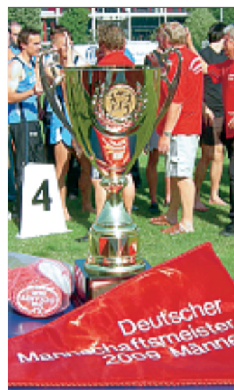
Fest in Kölner Hand. Die Gastgeber verteidigten den Mannschaftstitel.