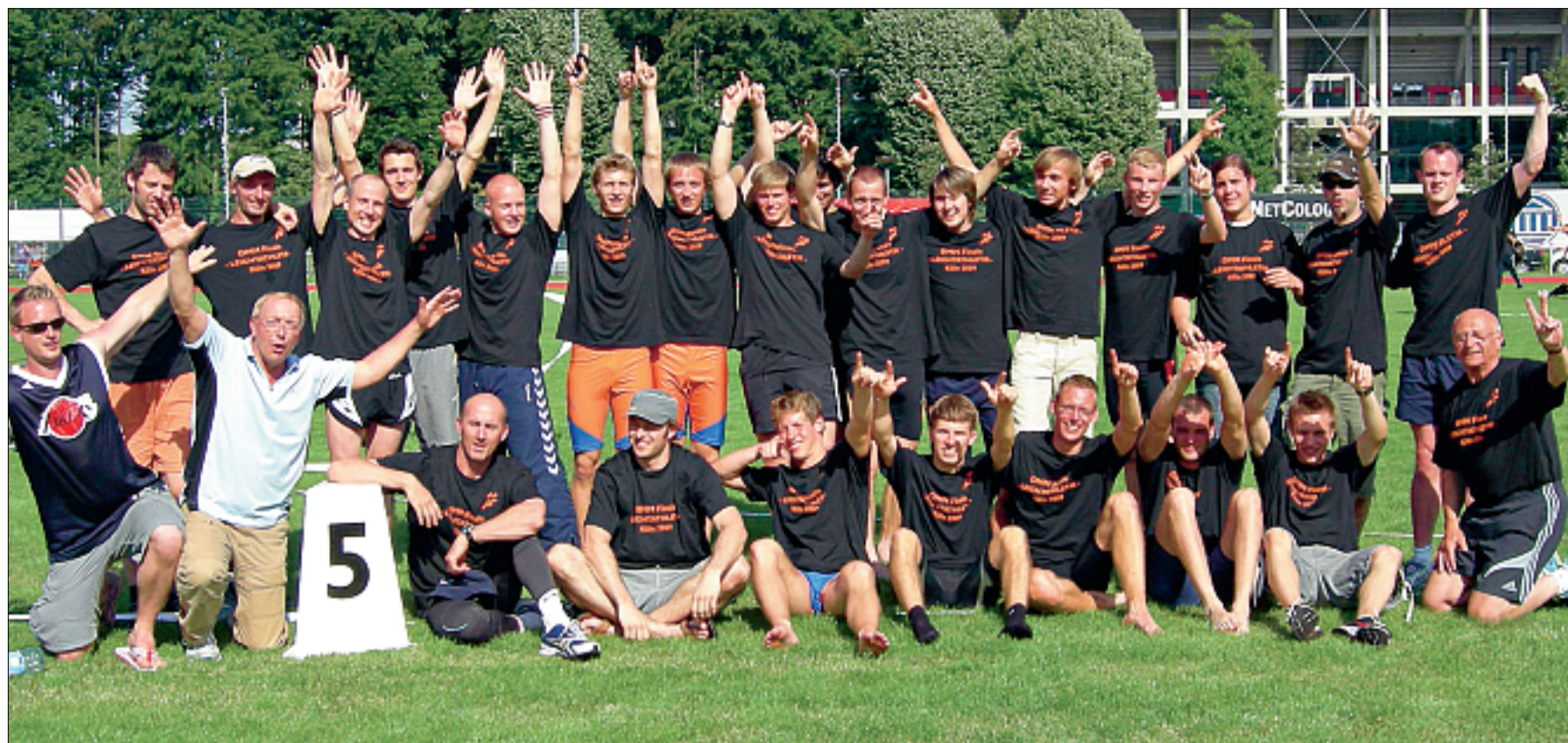
Starke Gemeinschaft. Im vergangenen Jahr meisterte die SG Norder TV/Germania Leer erstmals gemeinsam die Qualifikation. In Köln bestand sie auf Anhieb die Herausforderung Finale.