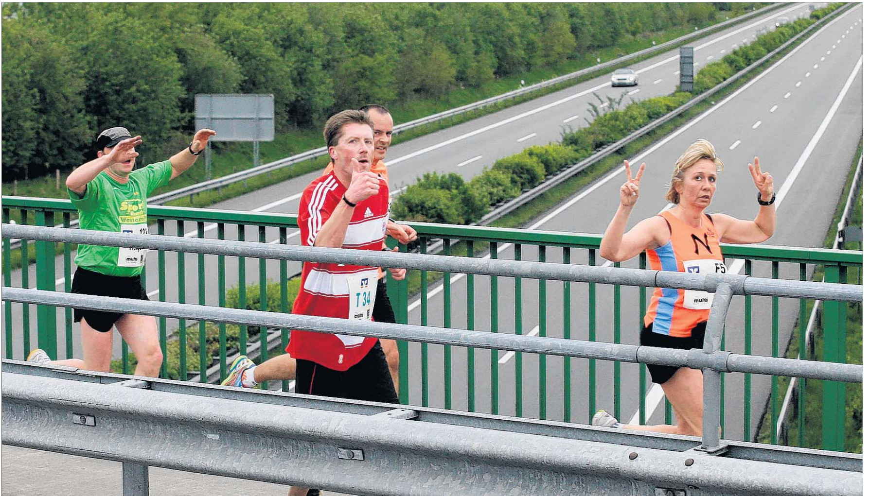
Premiere beim Ossiloop: Erstmals wurde die Autobahn 28 in Brinkum überquert. Die Läufer fanden Gefallen an der Streckenänderung.