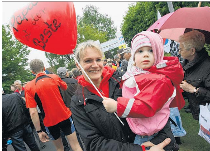
Mit der Unterstützung von Ehepartnern und Kindern lief es sich natürlich viel besser.

„Das ist fantastisch“, sagte Brahms, der 1982 bei der Premiere des Sechs-Etappen-