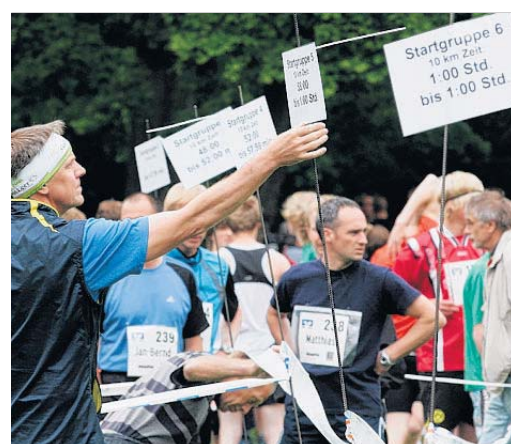
In verschiedene Startgruppen wurden die Läufer unterteilt.