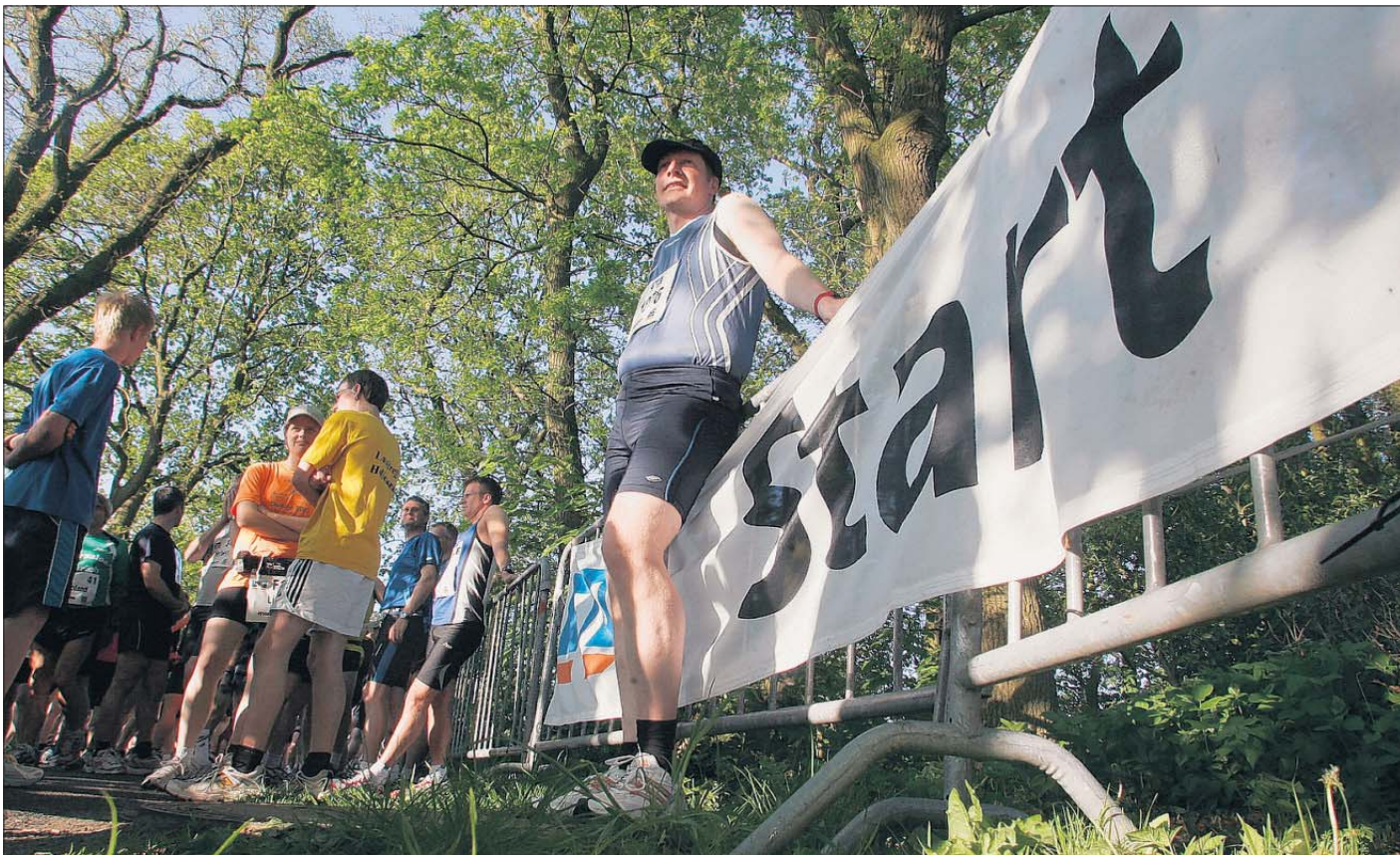
Auch dieser Läufer wartete gestern auf die Zeitnehmer. Weil diese stundenlang im Stau standen, verzögerte sich der Start zur zweiten Etappe um 35 Minuten.

Der Erfolg von Immega war gestern keine Überraschung –