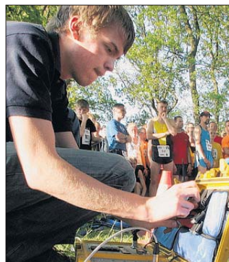
Sputen mussten sich die Zeitnehmer nach ihrer Ankunft.

Thema war viel mehr die Verspätung der Zeitnehmer. Diesen war im Grunde aber kein Vorwurf zu machen. Das Team aus Bergisch Gladbach benötigte am Dienstag zweieinhalb Stunden bis nach Leer. Die Gruppe fuhr wegen des Pfingstverkehrs gestern auch schon um 12 Uhr los. Diesmal dauerte die 295 Kilometer lange Reise wegen diverser Staus sieben Stunden.