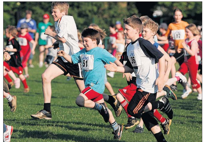
Mit Eifer und Spaß bei der Sache waren die Bambini- und zwar ohne Chaos pünktlich um 18.30 Uhr.