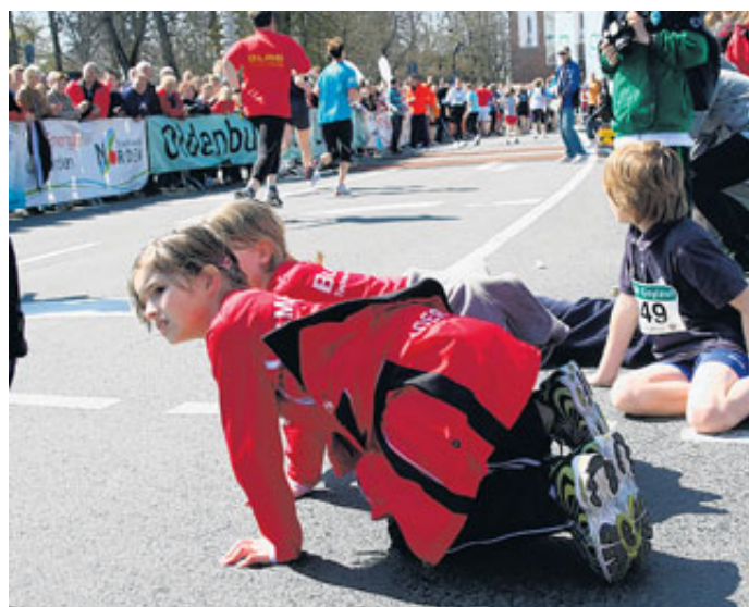
Auch viele junge Beobachter waren beim Norder Citylauf mit dabei.