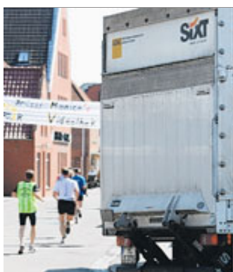
Dieser Laster aus München sorgte für Verwirrung.