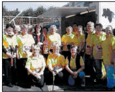
Die Landfrauen waren sogar mehrfach aktiv.