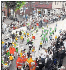
Nachwuchsjournalisten verfolgten den Bambini-Start aus ihrem Redaktionsbüro: dem Puppenstuben-Obergeschoss.