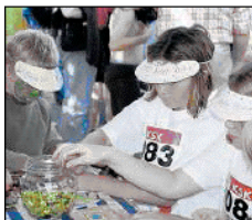
Basteln beim Kinderschutzbund.