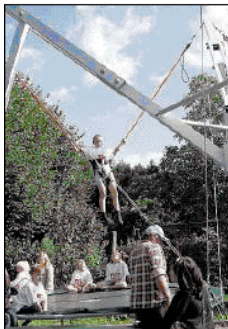
Hoch hinaus in den blauen Himmel ging es mit dem Trampolin.