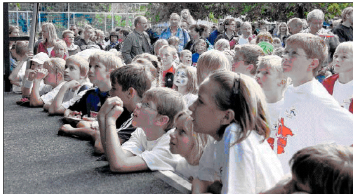
Die Bühne der Kinderwelten war immer umlagert.